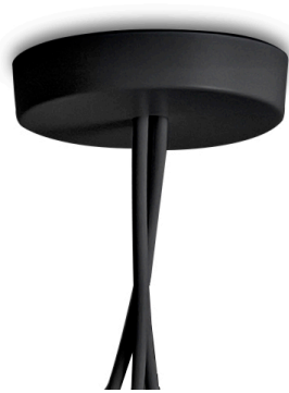
F0093030 Vielfach Rosette - Schwarz