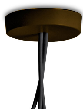
F0093026 Vielfach Rosette - Eloxiertes braun