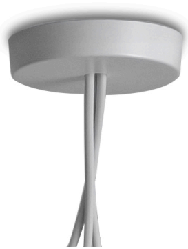
F0093009 Vielfach Rosette - Weiß