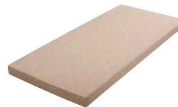
MA10 | MA15